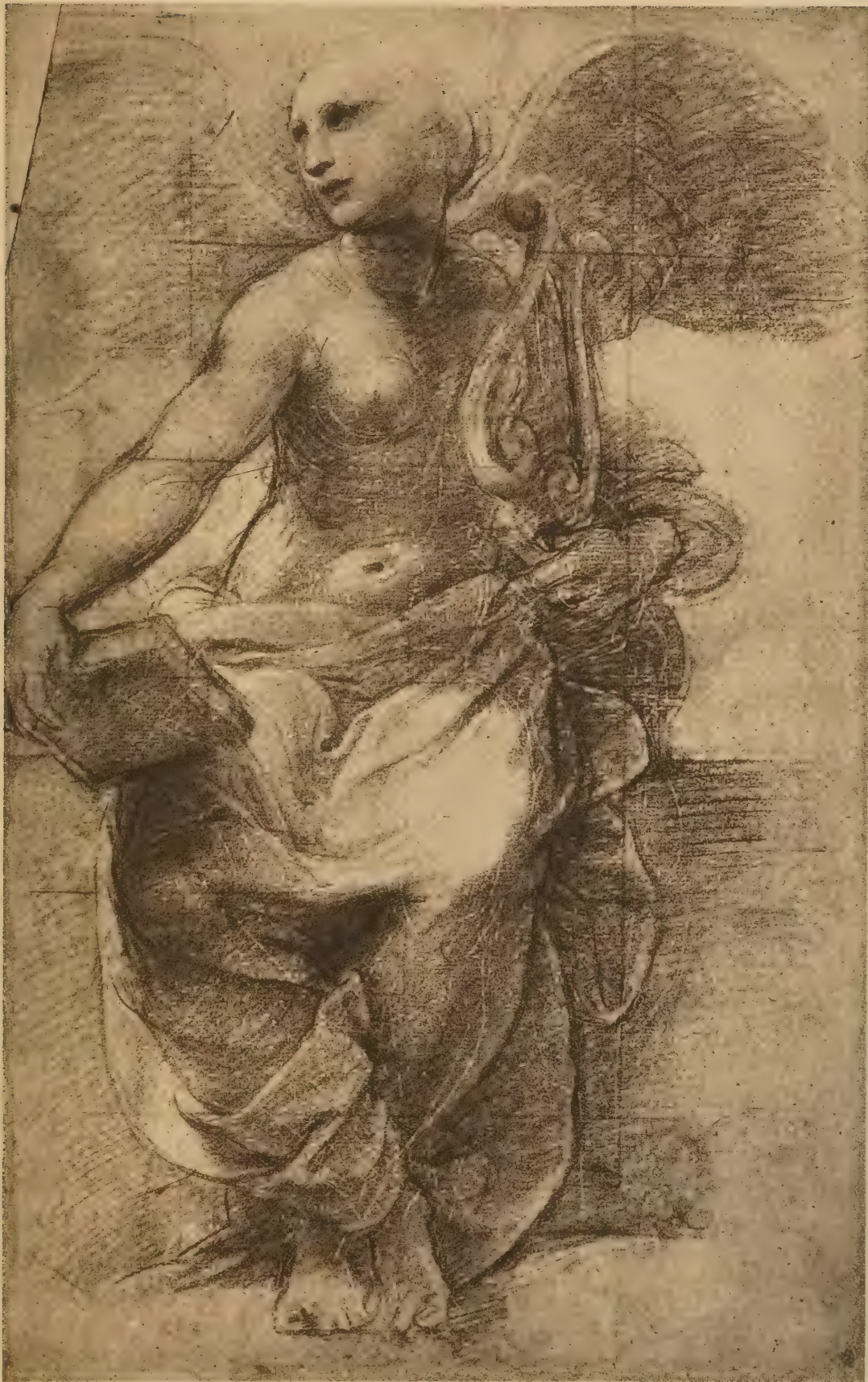
La Poésie (étude pour le plafond de la salle de la «Signature» au Vatican)